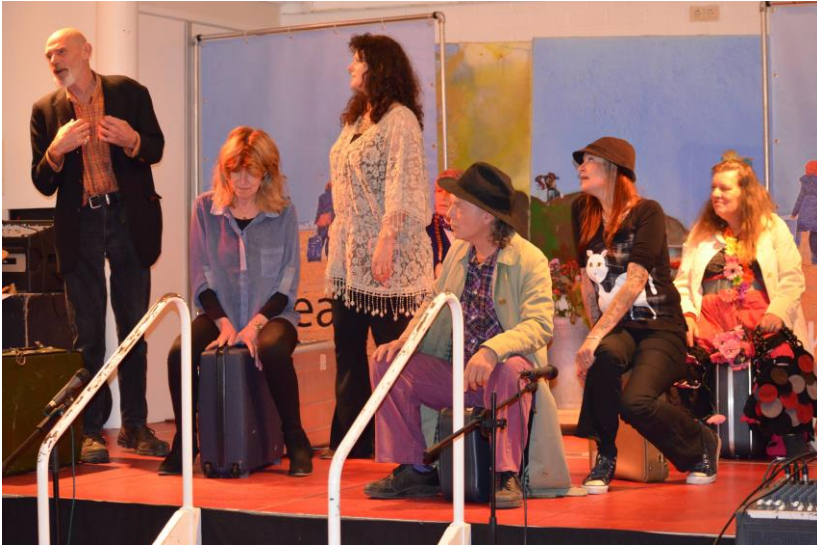
Voorstelling 'Zon op je pad' oktober 2017